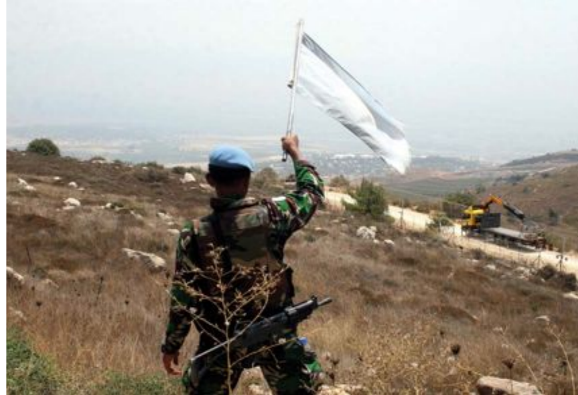
Finul. Un soldat servant dans la Force intérimaire des Nations unies au Liban (FINUL) tente de calmer la situation à la frontière libano-Israélienne, le 3 août 2010.