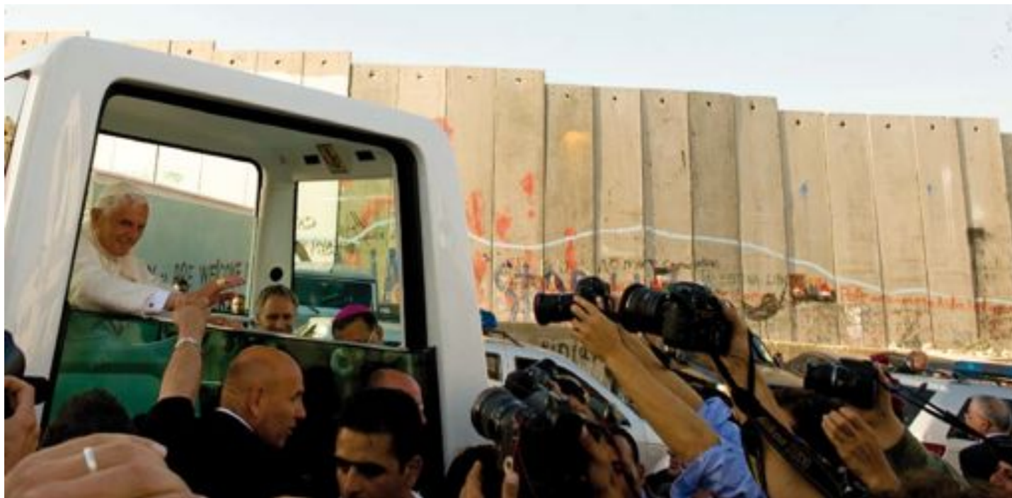
Le pape Benoît XVI dans le camp de réfugiés d'Aïda, Bethléem, le 13 mai 2009. « Bien que les murs puissent être facilement construits, nous savons qu'ils ne subsistent pas toujours : ils peuvent être abattus », dira-t-il ce jour-là.