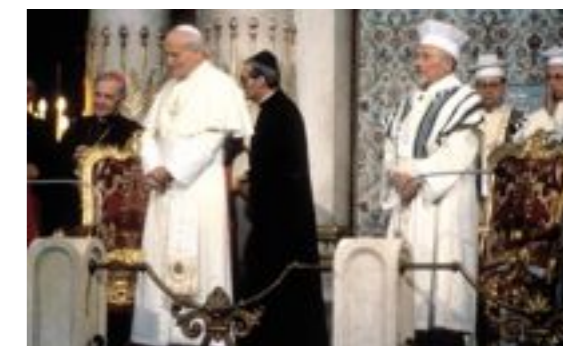
Visite historique de Jean-Paul II à la synagogue de Rome, 1986. Le Pape est accueilli par le Grand rabbin Elio Toaff. C'est la première fois qu'un pape pénètre officiellement à l'intérieur d'une synagogue.

PARTAGE : COMMENT GARDER UN ÉQUILIBRE DANS MON ANALYSE DE CE CONFLIT ?