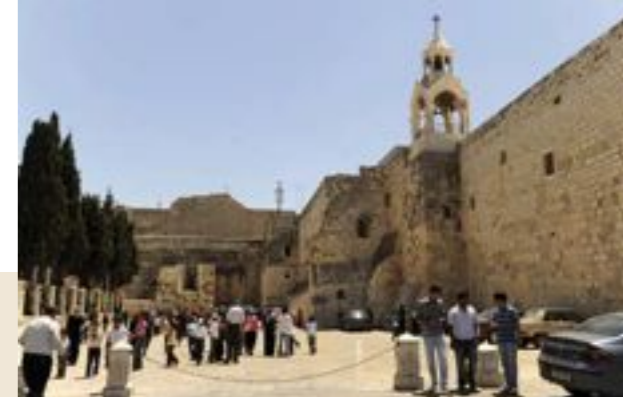
Basilique de la Nativité, Bethléem, lors du pèlerinage « Aux Sources – Terre Sainte 2009 », 28 Juillet 2009.

Kairos est un mot grec désignant le temps. Contrairement à chronos qui désigne le temps ordinaire ou chronologique, kairos désigne le temps sacré ou donné par Dieu, le temps de l'occasion opportune pour se repentir et le temps du renouveau : « Maintenant est le bon moment pour agir. » Reconnaître le kairos signifie reconnaître que c'est maintenant le temps d'agir pour la justice.