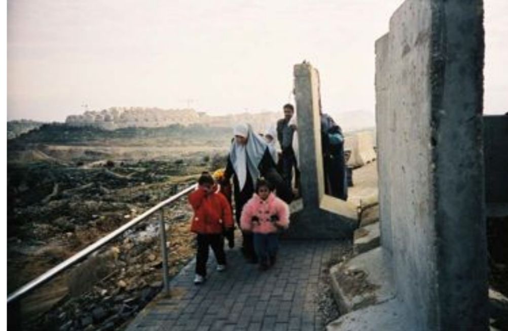
Bethléem, 2001 Check-point de Tantur à Bethléem. Au second plan, la colonie de Har-Homa, le 31 décembre 2001. Chaque jour, des milliers de Palestiniens doivent franchir les barrages et contrôles militaires israéliens des territoires occupés (« check-points »).

Si l'occupation reste la première préoccupation de la population palestinienne, le conflit intrapalestinien entre le Fatah et le Hamas, qui se traduit par une division de la société, est une nouvelle source de difficultés. Le boycott par la communauté internationale du nouveau gouvernement issu de la victoire du Hamas aux élections et le blocus israélien depuis 2006 n'ont fait que renforcer la mainmise du Hamas sur la bande de Gaza grâce au contrôle des tunnels avec l'Égypte.