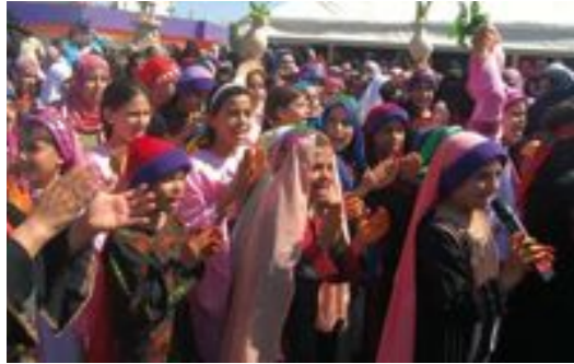
Khan Younés, bande de Gaza , octobre 2012. Spectacle des enfants lors du festival fêtant les 20 ans de l'association Culture et Pensée Libre.