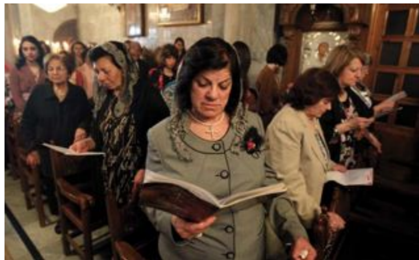
Ville de Gaza, avril 2012. Des catholiques palestiniens assistent à la veillée pascale et célèbrent la résurrection du Christ.