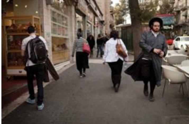
Jérusalem-Ouest. Une rue passante, novembre 2012.

Les débats sont vifs aujourd'hui sur la place de la religion entre les ultra-orthodoxes, dont la proportion a grandi au sein de la société, et ceux qui défendent la laïcité. Alors que la croissance économique est forte, les inégalités socio-économiques aussi se sont creusées. Pendant l'été 2011, 400 000 personnes ont manifesté dans les rues de Tel Aviv pour demander plus de justice sociale. Si le quotidien des Palestiniens est déterminé par la politique israélienne, beaucoup d'Israéliens se sentent peu concernés par la question palestinienne. Avec le mur de « séparation » les contacts avec les Palestiniens des territoires occupés sont presque inexistantes, et les nouvelles générations grandissent dans l'ignorance totale de l'Autre. ■