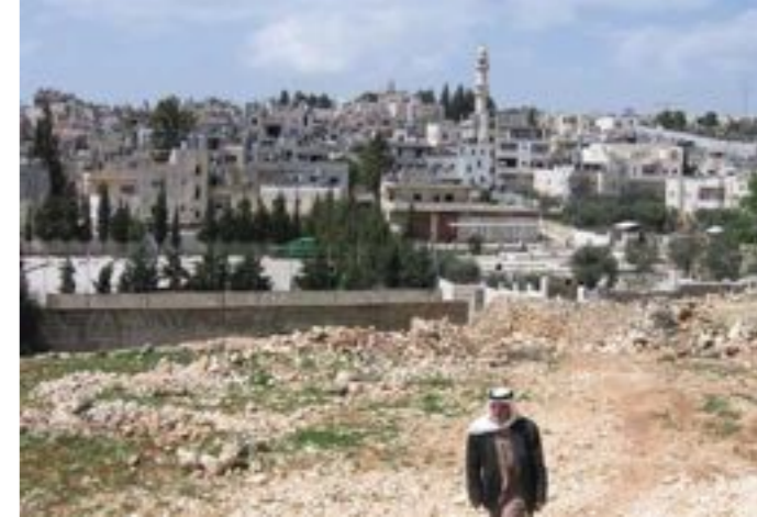
Bethléem, 2007. Un Palestinien sort du camp de réfugiés d'Aïda.

Les Palestiniens d'Israël (soit 1,7 million de personnes 3 ) représentent aujourd'hui plus de 20 % de la population israélienne. Ce sont les descendants de ceux qui n'ont pas été obligés de fuir et ont pu rester en Israël à la création de l'État en 1948. Ils sont devenus des citoyens israéliens, comme à Nazareth par exemple. S'ils bénéficient d'un bien meilleur niveau de vie socio-économique que les Palestiniens des territoires occupés, ils souffrent toujours de discriminations au sein de la société israélienne et ont dû abandonner une grande partie de leurs terres. Les Palestiniens des territoires occupés par Israël suite à la guerre des Six jours en 1967 (soit 4 millions de