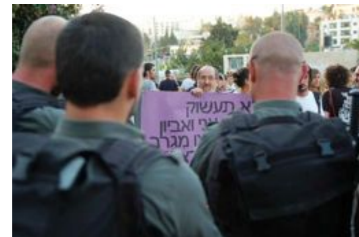
Manifestation à Sheikh Jarrah. Un Israélien manifeste contre l'expulsion par l'armée d'une famille palestinienne de sa maison et son remplacement par des colons. Quartier palestinien de Sheikh Jarrah, Jérusalem-Est, le 2 août 2009.

En septembre 2002, 27 pilotes de l'armée de l'air israélienne ont publié une lettre dans laquelle ils refusaient de prendre part à des bombardements sur des zones peuplées de civils palestiniens :